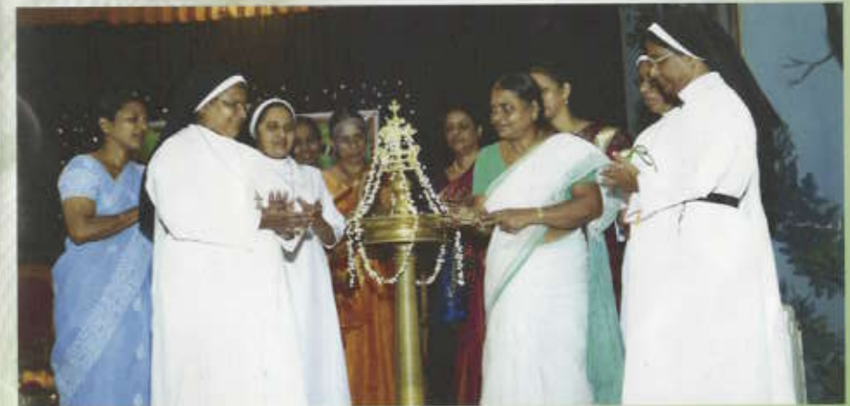
Inauguration of Alumnae Gathering on 07-02-2015