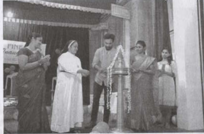
Fine Arts Inauguration by Shri. Amith Chakkalakkal, Cine Artist