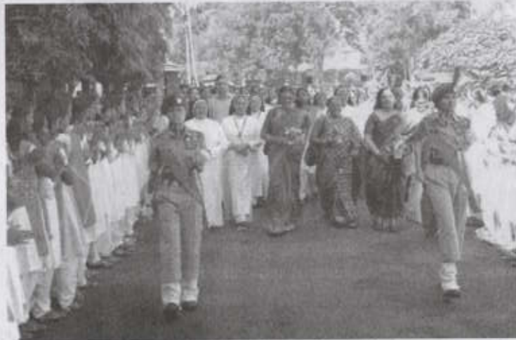
Warm Welcome given to NAAC Peer Team