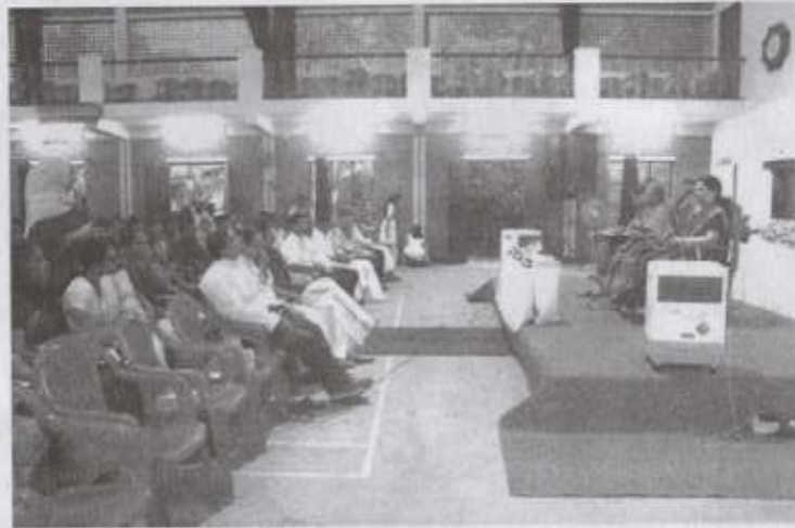
NAAC Peer Team Interaction with Alumnae & PTA Members