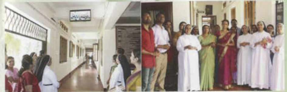
Inauguration of LED Wall T.V. sponsored by Carmel Alumnae Association

Retirement is inevitable and natural in one's life. On this occasion, we bid you all, a fond farewell we are really grateful to you for what you have been to us, all these years. On behalf of all, I sincerely wish you good health and peaceful retired life.